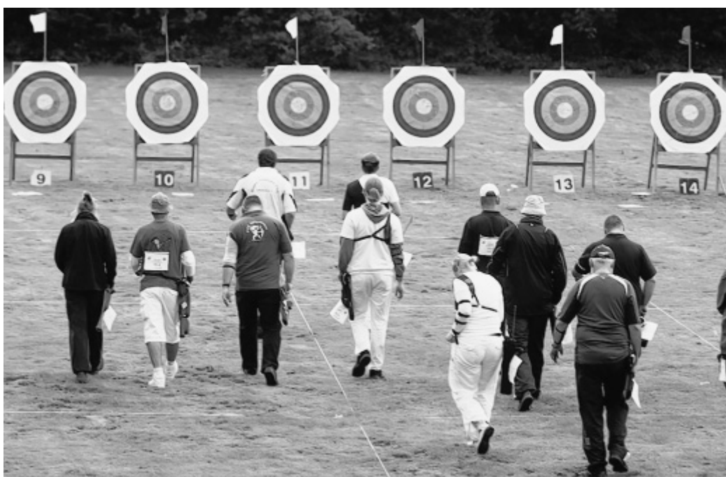
Der Kontrollgang: Nachdem die Teilnehmer ihre Pfeile auf die Scheiben geschossen haben, machen sie sich auf den Weg, um zu sehen wie gut sie getroffen haben.